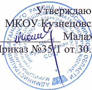
График питания обучающихся в школьной СТОЛОВОЙ